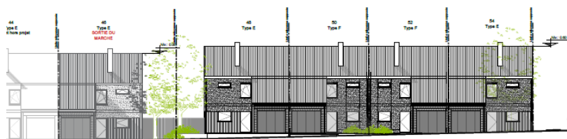
BLOC 1 - Rue Grand'Peine - Elévation Arrière