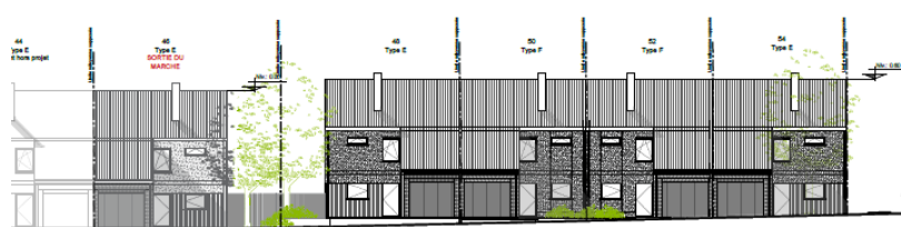
BLOC 1 - Rue Grand'Peine - Elévation Arrière