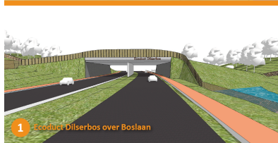
1 Ecoduct Dilserbos over Boslaan