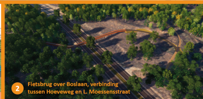
2 Fietsbrug over Boslaan, verbinding tussen Hoeweweg en L. Moessensstraat

In opdracht van het Agentschap Wegen en Verkeer (AWV) realiseert Franki Construct een ecoduct over de Boslaan (N75), ter hoogte van het recreatiedomein Sparrendal in Lanklaar. Zo moeten fietsers, voetgangers en dieren veilig kunnen bewegen tussen de natuurgebieden van het Nationaal Park Hoge Kempen die de Boslaan momenteel doorsnijdt. Het project gebeurt in samenwerking met het Agentschap voor Natuur en Bos, het Departement Omgeving, het Departement Mobiliteit en Openbare Werken, het Regionaal Landschap Kempen & Maasland, de stad Dilsen-Stokkem & VAPEO (Vlaams Actieprogramma Ecologische Ontsnippering).